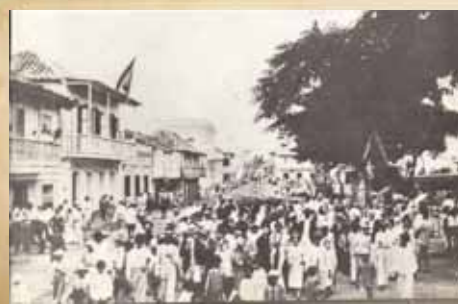
Antigua calle Rosario, hoy Betances