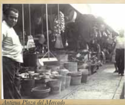
Antigua Plaza del Mercado