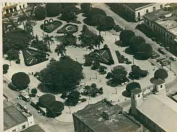
Vista aérea de la Plaza Santiago R. Palmer