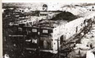
Fábrica de tabaco La Colectiva