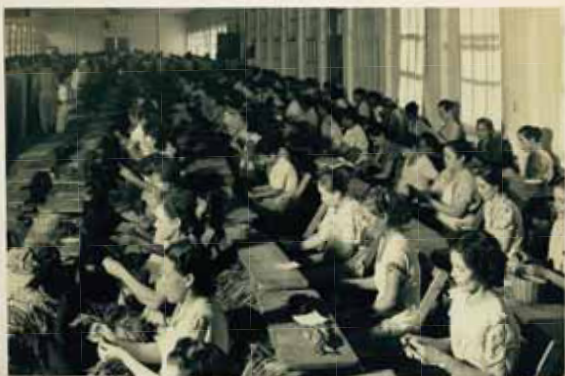
Mujeres cosiendo tabaco