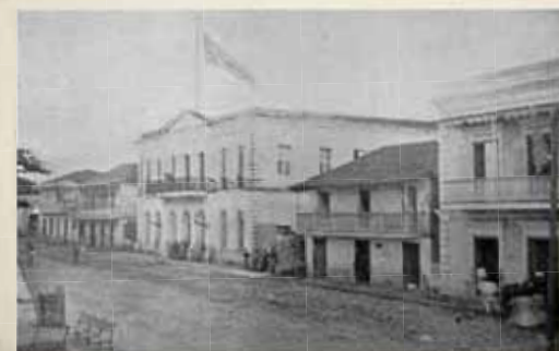
Casa Alcaldía con la bandera de EU en el 1898