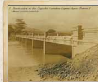
Puente sobre el Río Caguñas