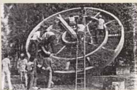
Jóvenes trabajan en el Reloj Floral de la Plaza, 1983