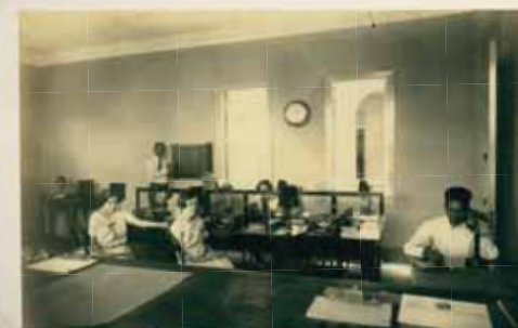
El Telégrafo frente a la Plaza Santiago R. Palmer