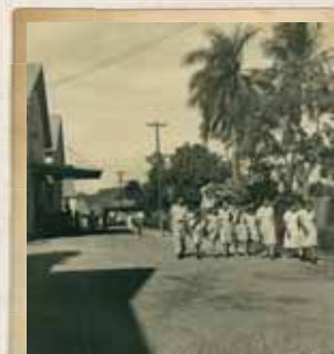
Calle del pueblo