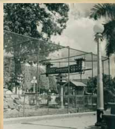
Aviario en la Plaza Santiago R. Palmer