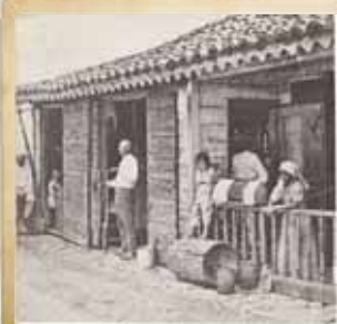
Antigua casa de la villa