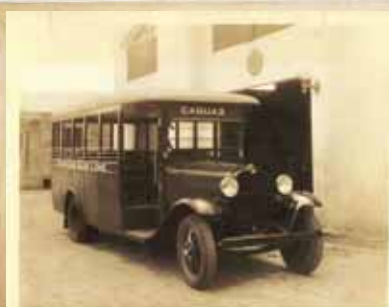
Primera guagua de pasajeros Caguas 1929