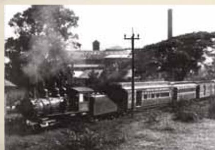
Servicio ferroviario de Río Piedras a Caguas