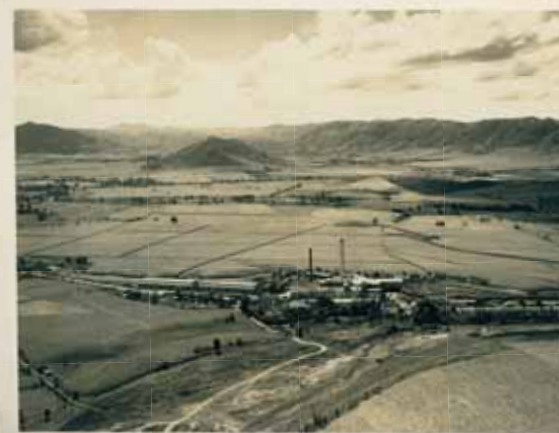
Vista aérea de la Central Azucarera