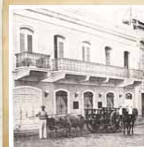
La carreta de buyes, 1931